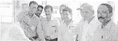
सावित्रीबाई फुले फोंड्यात आयोजित झालेल्या कार्यक्रमात सावित्रीबाई फुले प्रतिष्ठानातर्फे आयोजित झालेल्या कार्यक्रमात सावित्रीबाई फुले प्रतिष्ठानातर्फे आयोजित झालेल्या कार्यक्रमात...