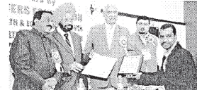
सावित्रीबाई फुले फोंड्यात आयोजित झालेल्या कार्यक्रमात सावित्रीबाई फुले प्रतिष्ठानातर्फे आयोजित झालेल्या कार्यक्रमात सावित्रीबाई फुले प्रतिष्ठानातर्फे आयोजित झालेल्या कार्यक्रमात...